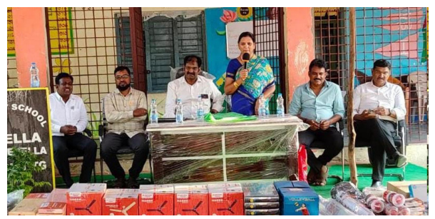
పర్యాటక మంత్రిని పాఠశాల ఉపాధ్యాయులు రోటరీ క్లబ్ సభ్యులకు కృతజ్ఞతలు తెలిపారు.