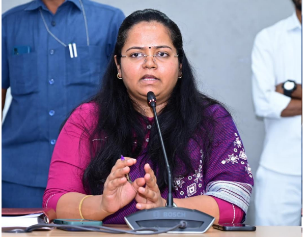
ఇన్స్పెక్టర్ మరియు డి.పార్టుమెంట్ కాలన్లు సు విధిగా రిజిస్టర్ నందు సమాచారం చేయాలన్నారు. పదవ తరగతి పరీక్షల నిమిత్తం 24 గంటల పాటు కంట్రోల్ రూమ్ జిల్లా విద్యార్థులు కార్యాలయంలో ఏర్పాటు చేయబడినది. కంట్రోల్ రూమ్ నెంబర్. 9848214166. పై సూచనలతో పాటు చీఫ్ సూపరింటెండెంట్, డి.పార్టుమెంట్ అఫ్ సెన్సర్ మరియు ఇన్స్పెక్టర్లకు ఇంతకముందే సరఫరా చేయబడిన పరీక్షల నిర్వహణ-శిక్షణ-కరదీపికోని సూచనలను పాటిస్తూ సజావుగా పరీక్షల సహకరించవలసినదిగా కోరవలెనని.

కేంద్రంలోని పరీక్షా నిర్వహణ సిబ్బందికి సూచనలు. పరీక్షా కేంద్రం నకు కేటాయించబడిన సిబ్బంది అందరూ గుర్తింపు కార్డును ధరించవలెను. పరీక్షా కేంద్రంలో పరీక్షా నిర్వహణకు కేటాయించబడిన సిబ్బంది తప్ప ఇతరులకు ప్రవేశం నిషేధించబడిందని చెప్పారు. పరీక్షా కేంద్రంలోని ముఖ్య పరీక్షా పర్యవేక్షకుని అనుమతిలేనిదే ఎవ్వరూ పరీక్షా కేంద్రంలోకి ప్రవేశం ఉండదని వెల్లడించారు. పరీక్షా కేంద్రం నకు చుట్టుపక్కల 100 మీటర్ల వరకు 163 డి.ఓ.ఎ. సెక్షన్ అమలులో ఉన్నందున జనం సమాహారంగా గుమిగూడి ఉండుట నిషేధించి చెప్పారు. ఆయా పరీక్షా కేంద్రంలో ఉదయం 8.00 నుండి సాయంత్రం 01.00 గంటల వరకు జిల్లా స్టాంపు ముసలి వుంచవలెను. పరీక్షా కేంద్రం లోకి చీఫ్ సూపరింటెండెంట్, డి.పార్టుమెంట్ అఫ్ సెన్సర్, ఇన్స్పెక్టర్, మెడికల్ సిబ్బంది, అటెండర్, వాలర్ బాయ్స్, అభ్యర్థులు మరియు ఇతర పరీక్షా నిర్వహణ సిబ్బంది ఎవ్వరూ కూడా సెల్ ఫోన్స్, షేజర్లు డి క్యాలక్యులేటర్ మరియు ఇతర ఎలక్ట్రానిక్ వస్తువులు తీసుకొని రావడం నిషేధం. అని తెలిపారు. కేంద్రంలో గుర్తింపబడిన సంబంధితులపై ప్రభుత్వ పరీక్షల మాల్ ప్రాక్టీసు నిరోధక చట్టం 25/ 1997 ప్రకారం క్రమ శిక్షణ చర్యలు చేపట్టబడును. అని అన్నారు. ప్రతి పరీక్షా కేంద్రం నందు ఏదైనా అత్యవసర సమాచారం తెలియజేయుటకు ఆయా పరీక్షా కేంద్రములకు ఆయా కేంద్రంలో విద్యుత్ కేటాయించబడిన పోలీస్ సిబ్బంది యొక్క ఫోన్ ను మాత్రమే వినియోగించవలెను. వివరించారు. ఇట్టి వినియోగానికి కూడా కాల రిజిస్టర్ నిర్వహించి