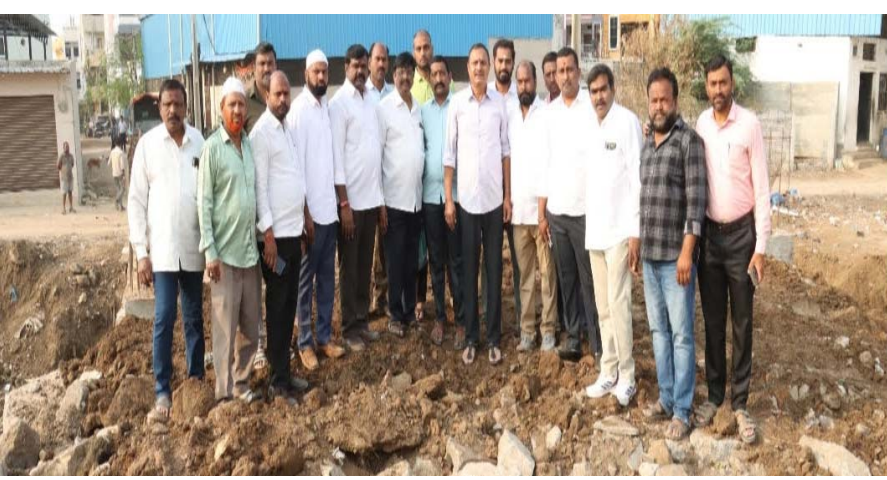
నాయకులు స్థానిక నాయకులు, కాలనీ వాసులు, కార్యకర్తలు తదితరులు పాల్గొన్నారు.