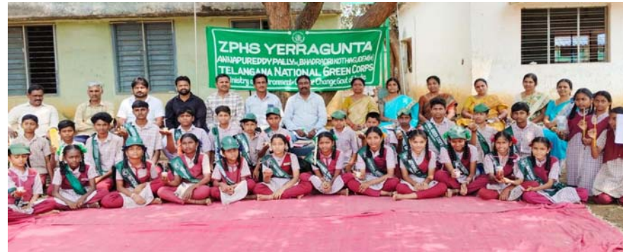
కొలవగలమో నేర్పించారు. ప్రపంచ ప్రపంచ సూరసి ఉష్ణోగ్రత నేడు 15 డిగ్రీల సెల్సియస్ గా నమోదయిందని ఇంకా రెండు డిగ్రీలు పెరిగితే ప్రపంచంలోని ప్రముఖ నగరాలు, కొన్ని దేశాలు సముద్రాలలో మునిగిపోయే ప్రమాదం ఉందని తెలియజేశారు. వాతావరణం అంశాల పట్ల అందరూ అవగాహన పెంపొందించుకోవాల్సిన అవసరం ఉందన్నారు. ఉపగ్రహాలు, రాడార్లు మరియు వాతావరణ కేంద్రాల వంటి అధునాతన పరిశీలన వ్యవస్థల ద్వారా సురక్షితమైన, మరింత పటిష్టమైన భవిష్యత్తును