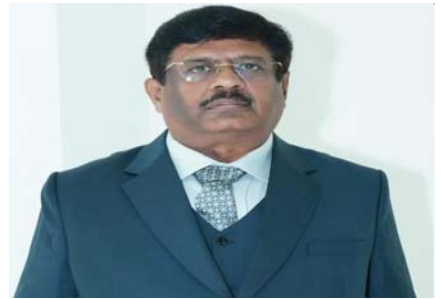
అప్పిలేట్ యంత్రాంగం సామర్థ్యం గణనీయంగా పెరుగుతుందని తెలిపారు.

మరింత బలోపేతం చేసే లక్ష్యంతో, ఈ ఉత్తర్వుల ప్రకారం దేశ వ్యాప్తంగా ఉన్న 22 మంది జీఎస్టీఏటీ జ్యూడిషియల్ సభ్యులను ఆయా రాష్ట్ర బెంచ్ లకు వైస్ ప్రెసిడెంట్లుగా నామినేట్ చేయడం జరిగిందన్నారు. తద్వారా ద్వారా జీఎస్టీఏటీ బెంచ్ ల పనితీరును మరింత సులభతరం, రాష్ట్ర స్థాయిలో నాయకత్వాన్ని బలోపేతం చేయడం తోపాటు జీఎస్టీ వివాదాలను వేగంగా పరిష్కరించడం ప్రధాన లక్ష్యం అన్నారు. ఈ నియామకం ద్వారా పరోక్ష పన్నుల వ్యవహారాల్లో న్యాయ పరిపాలన మరింత ప్రభావవంతంగా సాగుతుందని అన్నారు. అలాగే జీఎస్టీ విధానంలో