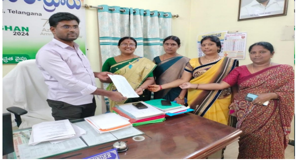
తొర్రూరు ఏప్రిల్ 01 (ప్రజాదర్శన్): తొర్రూరు మున్సిపాలిటీలోని తొమ్మిదవ వార్డులో దళిత మహిళలు నివాసం ఉంటున్న ఇంటి ప్రహారీ గోడ బాత్రూంలను మున్సిపాలిటీ అనుమతులు లేకుండా ఇచ్చిన ఇద్దరు వ్యక్తులపై చట్టరీత్యా చర్యలు తీసుకొని బాధిత మహిళలకు