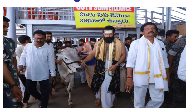
ండాలని కోరుకుంటున్నానని, స్వామి దర్శనం అనంతరం ఎంతో ఆనందంగా ఉందన్నారు. ఈ కార్యక్రమంలో ఆలయ ఉద్యోగులు, అర్చకులు పాల్గొన్నారు.