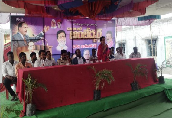
మరవెల్లి గ్రామ అంబేద్కర్ యువజన అధ్యక్షులు, సభ్యులు, మరవెల్లి సర్పంచ్, కార్యదర్శి, ఉపసర్పంచ్,వార్డు సభ్యులు, మాజీ సర్పంచ్ లు మాజీ ఎంపీటీసీ లు గ్రామ పెద్దలు, యువకులు, మహిళలు పెద్ద సంఖ్యలో పాల్గొని విజయవంతం చేశారు.