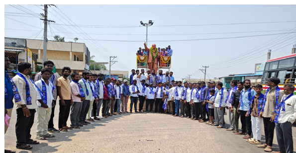
తంగళ్ళపల్లి, ఏప్రిల్ 14 (ప్రజా దర్శన్): రాజన్న సిరిసిల్ల జిల్లా తంగళ్ళపల్లి మండల కేంద్రంలోని జిల్లా గ్రామంలో డాక్టర్ బాబాసాహెబ్ అంబేద్కర్