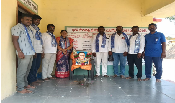
కార్యక్రమాలు, పాటలు, ప్రసంగాలు ఆకట్టుకున్నాయి.