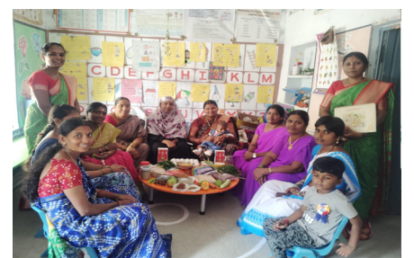
అవగాహన పెంపొందించడమే లక్ష్యంగా ఈ కార్యక్రమం విజయవంతంగా నిర్వహించబడింది.