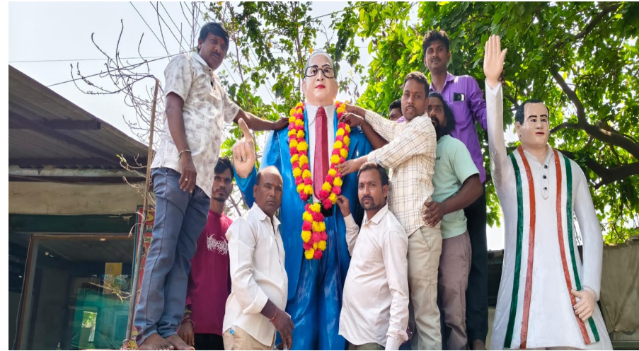
అందించా రని, కుల రహిత సమాజ స్థాపనకు, మహిళల ఆలోచనలను, ఆశయాలను, జ్ఞానాన్ని స్మరించుకోవడమే అభ్యున్నతికి ఆయన చేసిన కృషిని గుర్తుచేసుకున్నారు. ఆయన నిజమైన నివాళి అని ఈ సందర్భంగా గుర్తుచేసుకున్నారు.

కరకగూడెం, ఏప్రిల్ 14 (ప్రజాదర్శార్): మండల కేంద్రం లోని భారత రాజ్యాంగ నిర్మాత, సామాజిక సంస్కర్త డాక్టర్ బి.ఆర్.అంబేద్కర్ జయంతి సందర్భంగా అంబేద్కర్ విగ్రహానికి పూలమాలవేసి ఘనంగా సందర్భాలు జరుపుకోవడం జరిగింది. ఈ సందర్భంగా వారు మాట్లాడుతూ అంటరానితనం, కుల వివక్షపై పోరాడుతూ, దళితులు, మహిళలు, శ్రామికుల హక్కుల కోసం కృషి చేసిన బాబాసాహెబ్ అంబేద్కర్ జయంతి సందర్భంగా ఆయన స్మృతులను, ఆశయాలను స్మరించుకుంటూ నివాళులర్పించారు. అంబేద్కర్ రాజ్యాంగ సభ డ్రాఫ్టింగ్ కమిటీ చైర్మన్ గా దేశ రాజ్యాంగాన్ని రూపొందించి, సమానత్వం, స్వేచ్ఛ, న్యాయం అందించారని, అదే విధంగా అంటరానితనం నిర్మూలనకు మహాద్ సత్యాగ్రహం ప్రారంభించారు. కొలంబియా యూనివర్సిటీ, లండన్ స్కూల్ ఆఫ్ ఎకనామిక్స్ నుండి ఉన్నత విద్యనభ్యసించి, “బోధించు - సమీకరించు - పోరాడు” అనే సూత్రాన్ని