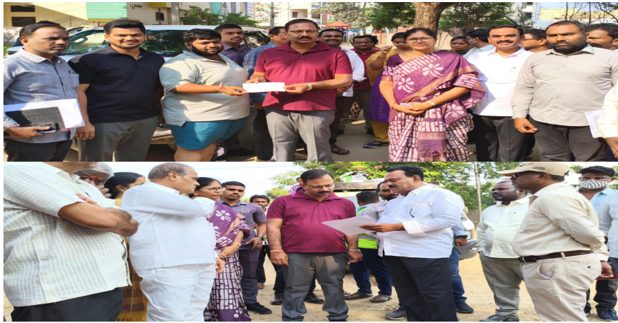
అధికారులను ఆదేశించారు. చంద్రపురి కాలనీలోని కార్మిక నగర్లో డ్రైనేజీ పనులను ప్రత్యేకంగా పరిశీలించిన కమిషనర్, పనులను వేగవంతం చేయాలని సంబంధిత అధికారులకు స్పష్టమైన సూచనలు జారీ చేశారు. ఈ పర్యటనలో మున్సిపల్ అధికారులు, సిబ్బంది పాల్గొన్నారు.