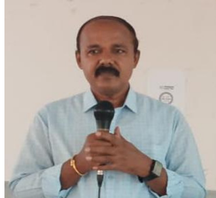
తమ పిల్లలను ప్రభుత్వ పాఠశాలలో చేర్చిస్తే మెరుగైన ఫలితాలు సాధించగలమని ఈ ఫలితాలు నిరూపిస్తున్నాయని ఆయన అన్నారు.