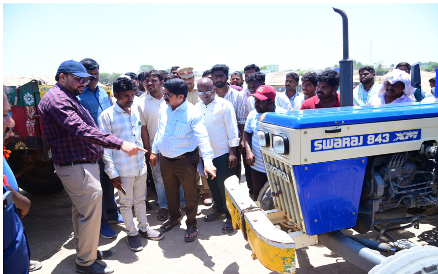
ప్రతి దశలో కట్టుదిట్టమైన పర్యవేక్షణ ఉండాలని ప్రజలకు అవసరమైన ఆసుక సులభంగా అందుబాటులోకి

నిరంతర పర్యవేక్షణ ఉండాలని, రాత్రి వేళలో తాను సీసీ కెమెరాల్లో రికార్డు పరిశీలిస్తానని కలెక్టర్ తెలిపారు. ఆన్లైన్ అనుమతులు లేకుండా ఎవరైనా ఆసుక తప్పకాలు లేదా రవాణా చేపడితే వారిపై కఠిన చర్యలు తీసుకుంటామని హెచ్చరించారు. అక్రమ ఆసుక రవాణాను అరికట్టేందుకు రెవెన్యూ, పోలీస్ శాఖలు సమన్వయంతో పనిచేస్తున్నాయని ఆయన తెలిపారు. అధికారులే నియమాలు ఉల్లంఘించినా బాధ్యత వహించాల్సి ఉంటుందని స్పష్టం చేశారు. ఆన్లైన్ విధానం ద్వారా ఆసుక పంపిణీ జరిగితే పారదర్శకత పెరిగి, అక్రమాలు తగ్గుతాయని కలెక్టర్ అభిప్రాయపడ్డారు. అనుమతి ఇచ్చిన ఆసుక రీచ్ ల నుండి ఆసుక అక్రమ రవాణా పై కఠిన చర్యలు తీసుకుంటామని, ప్రభుత్వ ఆదేశాల మేరకు మన ఆసుక మన వాహనం ఆన్ లైన్ పద్ధతిలోనే జిల్లాలో ఆసుక రవాణా జరగాలని కలెక్టర్ ఈ సందర్భంగా స్పష్టం చేశారు. మన ఆసుక -- మన వాహనం పోర్టల్లో నమోదు చేసుకున్న వాహనాలకు మాత్రమే ఆసుక రవాణా అనుమతులు ఇవ్వాలని అధికారులకు ఆదేశించిన కలెక్టర్,