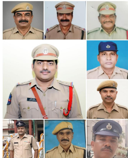
ఇదే సేవా స్ఫూర్తితో ప్రజలకు మరింత మెరుగైన సేవలు అందించాలని ఆకాంక్షించారు. రాష్ట్ర స్థాయి గుర్తింపు లభించడం జగిత్యాల జిల్లా పోలీస్ శాఖ ప్రతిష్టను మరింత పెంచినది పోలీస్ వర్గాలు పేర్కొన్నారు.