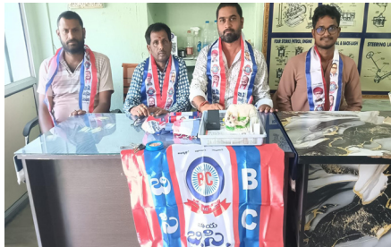
లేవు విచారణ లేదు యదేవుగా దోపిడీ చేయడానికి వారికి లైసెన్స్ ఇచ్చే విధంగా ప్రవర్తిస్తున్నారు. జి.ఓ. ఎమ్ఎస్ నెంబర్ 91 తేదీ 6-08-2009 ప్రకారం ప్రైవేటుపాఠశాలలు కనీసం మూడు దుకాణాల

ప్రజాదర్శార్, కరీంనగర్ : ప్రైవేట్ పాఠశాలలు, కళాశాలలు తమ ఇష్టానుసారంగా ఫీజులను వసూలు చేస్తూ తల్లిదండ్రులను పిప్పి పిలుస్తున్నారు ప్రభుత్వం వెంటనే ఫీజులు నియంత్రణ చట్టాన్ని అమలు చేసి ఏవ పాఠశాలకు ఎంత ఫీజులు ఏ కళాశాలకు ఎంత ఫీజులు అని ప్రభుత్వం నియంత్రణ చేయాల్సి ఉందని ప్రైవేట్ కార్పొరేట్ పాఠశాలల కళాశాల దోపిడీని అరికట్టాలి ప్రభుత్వం లక్షలాది రూపాయలు తల్లిదండ్రుల నుండి దోచుకున్న దీనిని పట్టించుకోవడం లేదు. జిల్లా స్థాయిలో పర్యవేక్షించాల్సిన జిల్లా విద్యాశాఖ అధికారి మండల విద్యాశాఖ అధికారులు ప్రైవేట్ పాఠశాలలతో కుమ్ముకపుతున్నారు. ఎన్ని ఫిర్యాదు చేసిన దానిపై చర్యలు