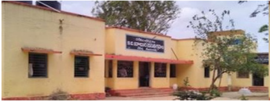
అధికారి కార్డు గత తరగతి మార్కుల మెమో స్టడీ సర్టిఫికేట్/బోనఫైడ్ పాస్పోర్ట్ సైజ్ ఫోటోలు విద్యార్థులు పూర్తి వివరాల కోసం సంబంధిత శాఖ అధికారులను లేదా హాస్టల్ నిర్వాహకులను సంప్రదించాలని సూచించారు. సంప్రదించవలసిన ఫోన్ నంబర్: 93944 18143

రంగారెడ్డి జిల్లా బ్యూరో 16 జూన్ (ప్రజాదర్శార్):- తెలంగాణ షెడ్యూల్డ్ కులాల అభివృద్ధి శాఖ ఆధ్వర్యంలో నిర్వహిస్తున్న ప్రభుత్వ హాస్టళ్లలో 2026-27 విద్యా సంవత్సరానికి విద్యార్థుల ప్రవేశాల కోసం ఆన్లైన్ దరఖాస్తులు ఆహ్వానిస్తున్నట్లు అధికారులు తెలిపారు. షాద్ నగర్ పరిసర ప్రాంతాలకు చెందిన అర్హులైన విద్యార్థులు ఈ అవకాశాన్ని వినియోగించుకోవాలని సూచించారు. షాద్ నగర్ పట్టణంలోని క్రిస్టియన్ కాలనీలో, హెచ్.డి.ఎఫ్.సీ బ్యాంక్ సమీపంలో ఉన్న ప్రభుత్వ ఎస్సీ బాలర హాస్టల్ లో వసతి సౌకర్యం అందుబాటులో ఉంది.