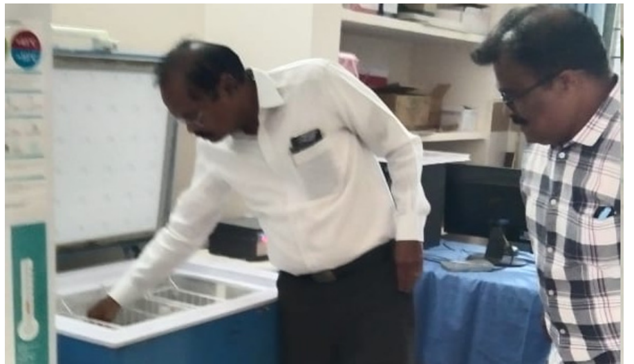
ఇవ్వాలని ఆదేశించారు. ఈ సందర్భంగా ఆయన అక్కడ అధికారులు పేషంట్లతో మాట్లాడారు.