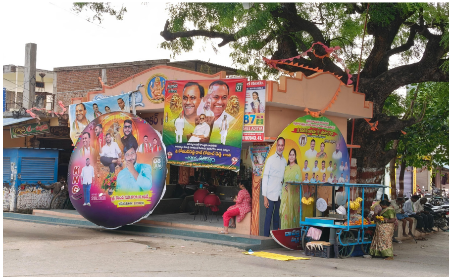
సంస్థాండ్లో ఫ్లెక్సీల ఏర్పాటు, కార్యక్రమాల అమలు చేయాలని ప్రయాణికులకు ఎలాంటి ఇబ్బందులు నిర్వహణపై అధికారులు దృష్టి సారించి నిబంధనలు లేకుండా చర్యలు తీసుకోవాలని స్థానికులు కోరుతున్నారు.

సంస్థాన్ నారాయణపురం, ప్రజాదర్శార్ జూన్ 8: సంస్థాన్ నారాయణపురం మండల కేంద్రంలోని బస్టాండ్ ప్రస్తుతం ప్రయాణికుల కోసం కాకుండా రాజకీయ ఫ్లెక్సీలు, వివిధ కార్యక్రమాలకు అడ్డాగా మారిన విమర్శలు వినిపిస్తున్నాయి. ఏ చిన్న కార్యక్రమం జరిగినా బస్టాండ్ ముఖద్వారానికి అడ్డంగా భారీ ఫ్లెక్సీలు ఏర్పాటు చేస్తుండటంతో ప్రయాణికులు తీవ్ర ఇబ్బందులు ఎదుర్కొంటున్నారు. రాజకీయ నాయకుల జన్మదినాలు, జయంతలు, వర్ధంతి కార్యక్రమాలు తరచూ బస్టాండ్ ప్రాంగణంలోనే నిర్వహిస్తుండటంతో బస్టాండ్ సందడిగా మారుతోంది. ఫ్లెక్సీలు బస్సుల రాకపోకలను కనిపించనివ్వకపోవడంతో ప్రయాణికులు ఎండలో రోడ్డుపై నిలబడి బస్సుల కోసం ఎదురుచూడాల్సి వస్తోందని ఆవేదన వ్యక్తం చేస్తున్నారు. ముఖ్యంగా వృద్ధులు, మహిళలు, విద్యార్థులు ఎక్కువగా ఇబ్బందులు పడుతున్నారని స్థానికులు చెబుతున్నారు. ప్రజా రవాణా కేంద్రంగా ఉన్న బస్టాండ్ను రాజకీయ కార్యక్రమాలకు వేదికగా మార్చడం సరికాదని అభిప్రాయపడుతు