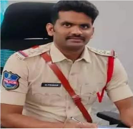
ంచుతాం" అని ఎస్ఐ కోరారు. డీఎస్పీ సతీష్ కుమార్ ఆదేశాల మేరకు నూతన డీజీపీ సూచనలను పక్కాగా అమలు చేస్తున్నట్లు ఎస్ఐ తెలిపారు

"శాంతిభద్రతల విషయంలో ఎంతటి వారినైనా ఉపేక్షించేది లేదు. రాజకీయ ఒత్తిళ్లకు తలొగ్గేది లేదు. చట్టం ముందు అందరూ సమానమే" అని స్పష్టం చేశారు. 4. లిఅక్రమాలపై స్పెషల్ డ్రెస్:లి పోలవరం బ్యాక్ వాటర్ ప్రభావిత గ్రామాలైన సారపాక, లక్ష్మిపురం లో వలస కూలీల ముసుగులో నేరాలకు పాల్పడుతున్న వారిపై ప్రత్యేకంగా నిఘా ఉంచాం. గత వారం డ్రంక్ అండ్ డ్రైవ్ తనిఖీల్లో 11 మందిని పట్టుకొని కోర్టులో హాజరుపరిచారు. అందులో ఇద్దరికి జైలు శిక్ష పడింది. బహిరంగంగా మద్యం సేవిస్తున్న కఠిన చర్యలు తీసుకుంటామని హెచ్చరించారు. రాత్రి గస్తీని ముమ్మరం చేశారు. "మీ పరిసరాల్లో అనుమానాస్పద వ్యక్తులు, అసాంఘిక కార్యకలాపాలు కనిపిస్తే వెంటనే 100కు డయల్ చేయండి లేదా స్టేషన్ కు సమాచారం ఇవ్వండి. సమాచారం ఇచ్చిన వారి వివరాలు గోప్యంగా ఉ